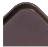
Diseño de perfil alto